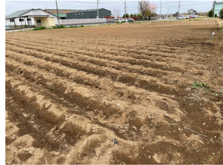
じゃがいもの植え付け

ニッコクトラストは、埼玉県深谷市に障がい者を雇用する農場「ニッコクファーム」を開場しました。株式会社アクアライフ.JPによる農業指導の協力を得て、当社の農場管理者と障がい者が農場の運営管理を行います。ニッコクトラストは、SDG'sの取り組みの一つとして食材となる野菜の栽培農業を行い、その中で障がい者の方の雇用と自立支援、地域が目指す産業振興と交流の全てを満たすことが出来る農福連携事業に取り組みます。